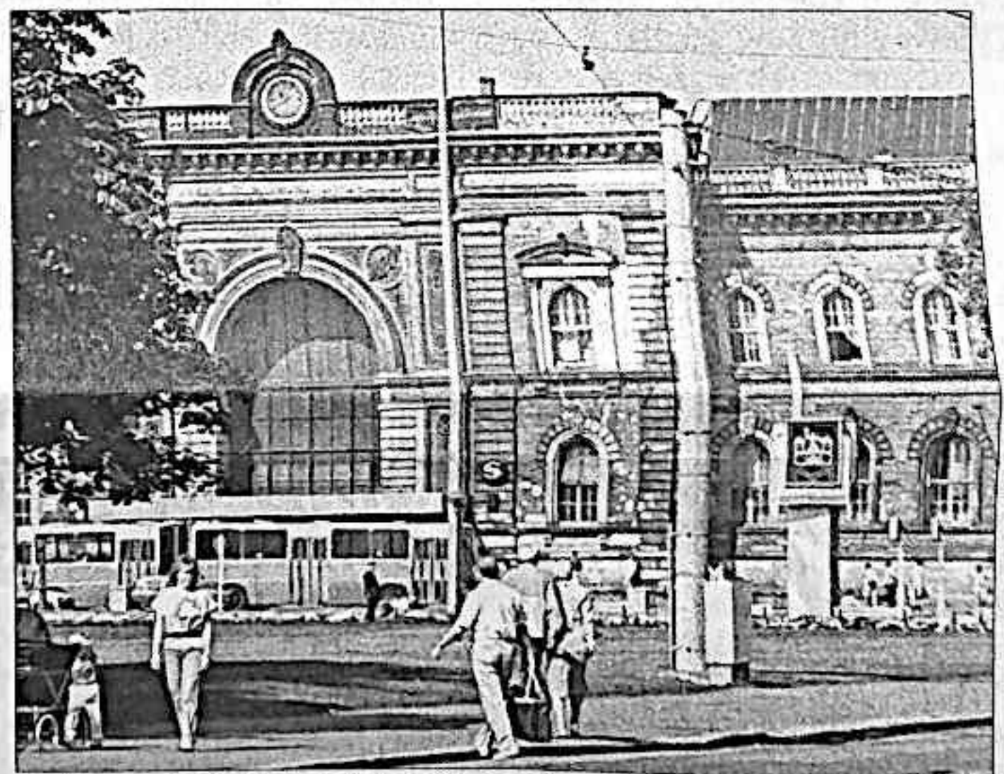
Auf dieser Aufnahme ist die Stele an ihrem ursprünglichen Platz vor dem Hauptbahnhof zu erkennen.

Begrüßt wurde dieser damals nicht nur von der Säule. „Tausende Magdeburger entboten Erich Honecker und seinen Gästen ihr herzliches Willkommen. Hochrufe und tosender Beifall empfangen sie“, berichtete damals die Volksstimme. Grund seines Besuches war übrigens eine Hasenjagd.